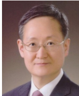
봉욱 前대검찰청 차장검사