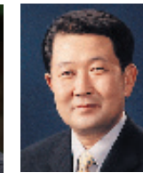
박주선 한국석유협회 회장/前국회부의장