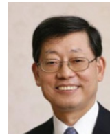
김황식 제41대 대한민국 국무총리