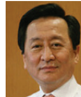
최수현 前금융감독원 원장