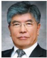
김중수 前한국은행 총재