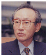
전운철 前부총리 겸 재정경제부 장관