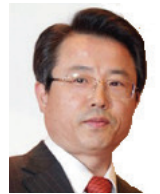
권희세 前금융감독원 원장