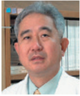
백재승 서울대학교 의과대학 명예교수