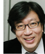
신울 명지대학교 교수