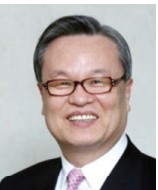
인명진 前자유한국당 비상대책위원장