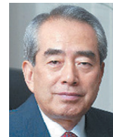
김영수 前청와대 민정수석