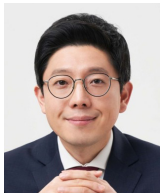
김병민 서울시 경무부시장