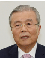
김종인 前국민의힘 비상대책위원회 위원장