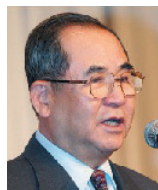
이수성 제29대 대한민국 국무총리