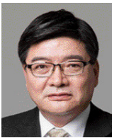
김용진 前국민연금공단 이사장