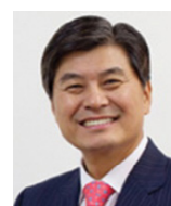
이춘희 前세종특별자치시 시장