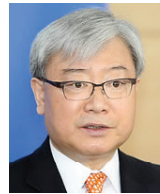
김석동 前금융위원회 위원장