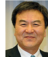
신제윤 前금융위원회 위원장