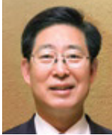
양승조 前충청남도 도지사