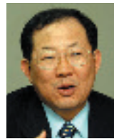
박병원 前한국경영자총협회 회장