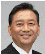
이광재 前국회 사무처 사무총장