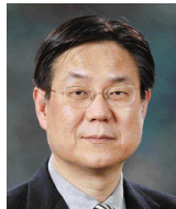
이관섭 前대통령비서실 비서관