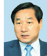
유정복 인천광역시 시장