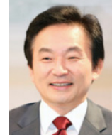
원희룡 前국토교통부 장관