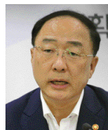
홍남기 前부총리 겸 기획재정부 장관