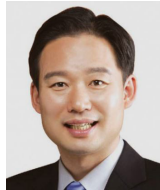
신지호 국민의힘 전략기획부총장