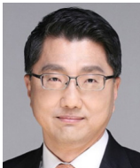
진웅섭 前금융감독원 원장