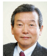
정희원 서울대학교 의과대학 교수 前서울대학교병원 원장