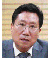
양정철 前민주연구원 원장