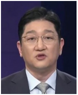
김명우 TV조선 앵커