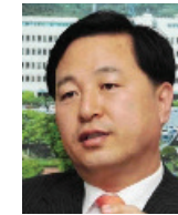
김두관 국회의원 前경상남도 도지사