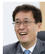
함진규 한국도로공사 사장